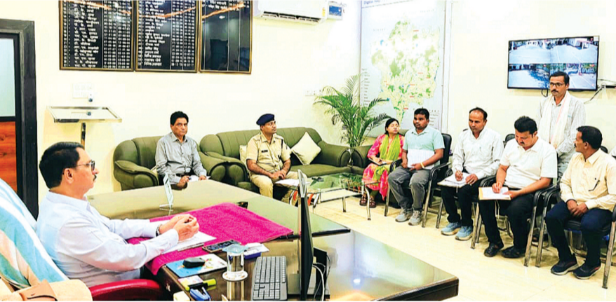
हरिभूमि न्यूज़ ▶ टीकमगढ़

जिले में युवाओं और बच्चों के सर्वांगीण विकास, खेल प्रतिभाओं के संवर्धन तथा उन्हें सकारात्मक गतिविधियों से जोड़ने के उद्देश्य से ग्रीष्मकालीन खेल प्रशिक्षण शिविर 2026 के आयोजन की तैयारियां तेज हो गई हैं। पुलिस अधीक्षक मनोहर सिंह मंडलोई के मार्गदर्शन में आयोजित इस शिविर को लेकर पुलिस अधीक्षक कार्यालय में पुलिस अधिकारियों, खेल विभाग के पदाधिकारियों और प्रशिक्षकों की संयुक्त बैठक संपन्न हुई, जिसमें शिविर की विस्तृत रूपरेखा तय की गई। बैठक में एसपी मंडलोई ने स्पष्ट किया कि यह समर कैम्प टीकमगढ़ पुलिस और खेल विभाग के संयुक्त तत्वावधान में 1 मई से 30 मई तक पुलिस लाइन परिसर में आयोजित किया जाएगा। शिविर के सफल संचालन के लिए सुरक्षा, आधारभूत सुविधाएं और प्रशिक्षित कोचों की उपलब्धता सुनिश्चित करने के निर्देश दिए गए हैं। इस समर कैम्प में आउटडोर और इनडोर दोनों प्रकार की गतिविधियों को शामिल किया गया है। प्रतिभागियों को फुटबॉल, एथलेटिक्स, सॉफ्टबॉल, हॉकी जैसे खेलों के साथ-साथ सेल्फ डिफेंस, योग, ईश्लिया स्मोकन कोर्स,