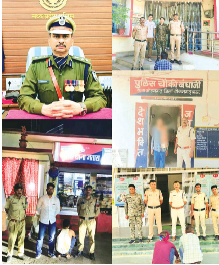
हरिभूमि न्यूज़ ▶ टीकमगढ़