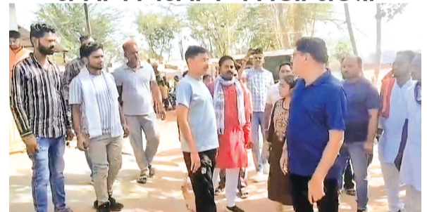
हरिभूमि न्यूज़ ▶ टीकमगढ़